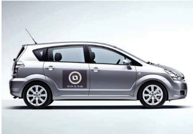
CARRÉ 0,6 M X 0,8 M

LES ADHÉSIFS SONT APPOSÉS SUR LES FLANCS OU LA VITRE ARRIÈRE