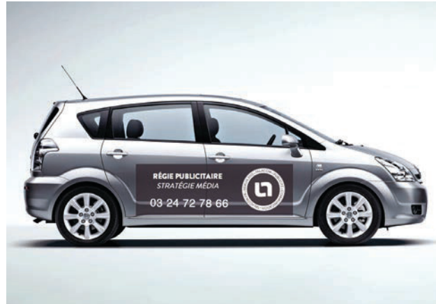
GRAND CÔTÉ 1,5 M X 0,5 M