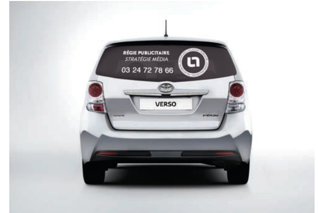
MICRO PERFORÉ 1,5 M X 0,5 M